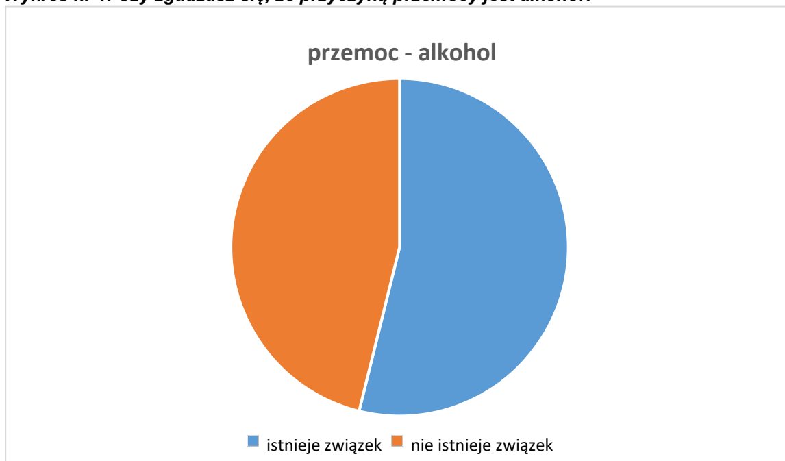
Wykres nr 1. Czy zgadzasz się, że przyczyną przemocy jest alkohol?